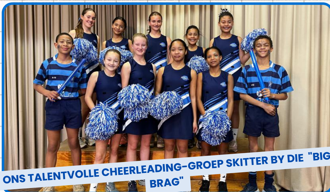
ONS TALENTVOLLE CHEERLEADING-GROEP SKITTER BY DIE "BIG BRAG"